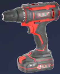
58 € Ref: 929578 APARAFUSADORA A BATERIA HCT