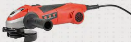
Ref: 916172 REBARBADORA 900W 125MM HCT AG1391