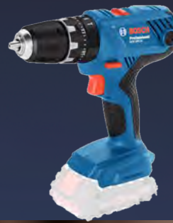
254 € Ref: 603544 BERBEQUIM BOSCH GSB 18V-21 PRO