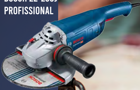
Ref: P000180 REBARBADORA BOSCH 22-230J PROFESSIONAL