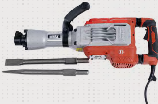
Ref: 934114 MARTELO DEMOLIDOR PROFI HCT - EH 1093 60J1