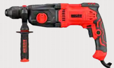
Ref: 985032 MARTELO PNEUMATICO 1050W SDS-PLUS HCT 1081